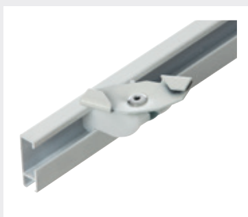
Vridfäste för innertak