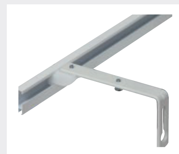
Vinkelhållare (På 50 mm konsol får 1 takfäste plats, 100 mm 2 st, 150 mm 3 st, 200 mm 4 st.)